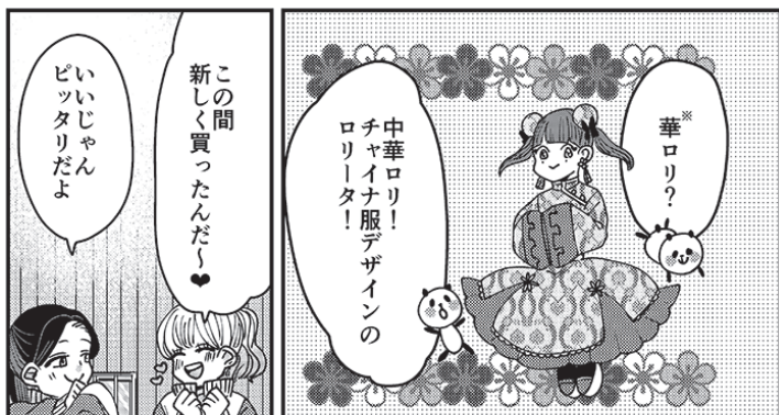
※中国のチャイナドレスとロリータを融合させたスタイル。「QI LOLI」(チーロリ)とも言う。